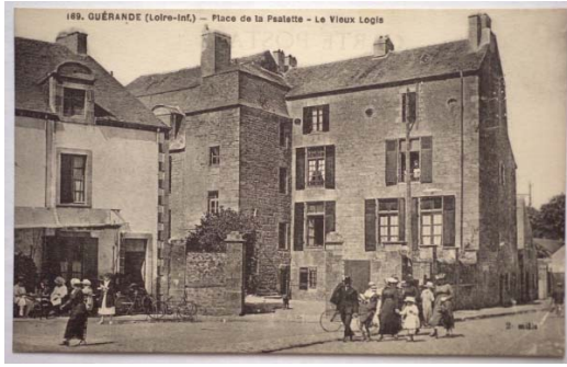
Hôtel de Coux, 1 place de la Psallette- Guérande