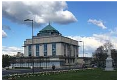
Bibliothèque de Tours

(hôtels de Than et d'Escoville) et Tours, Luçon, Paris (portes Saint-Denis et Saint-Martin, musée Rodin, Colonne de Juillet, hôtel des Invalides, etc.).