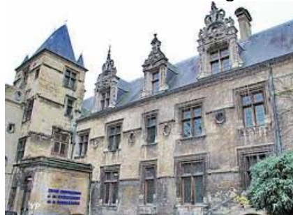
Hôtel de Than

Il est alors chargé de quatre départements – Vienne, Deux-Sèvres, Vendée et Eure-et-Loir –, où il restaure de nombreux édifices. Il est également membre de la Commission de protection des sites et paysages, pour trois de ces départements – Eure-et-Loir, Deux-Sèvres, Vienne –, et chargé de bâtiments à Caen