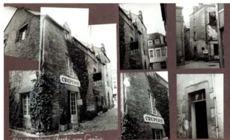
Ilot 15 - Rue du Vieux Marché aux Grains

Le travail de Charles Dorian, ses albums photographiques constitués par « îlots », et ses plans sont conservés au service des archives de la ville de Guérande.