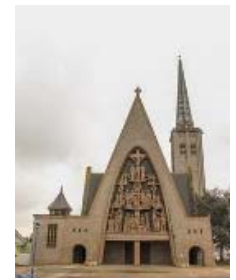
Eglise de Donges

Parmi les réalisations remarquables qu'il a signées ou auxquelles il a participé, citons : le pavillon du Métal et le pavillon d'Haïti à l'Exposition internationale de Paris en 1937, la bibliothèque municipale de Tours (construite sur les plans de Charles et Jean - son frère) aidés de Pierre Patout et exécutée par Maurice Boille