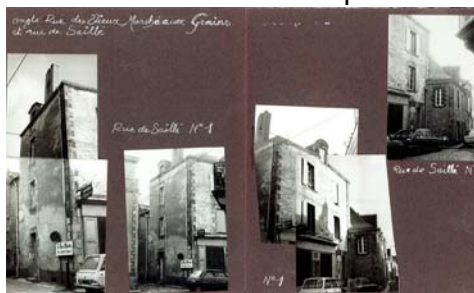
Ilot 15 - Rues du Vieux Marché aux Grains et de Saillé

Elles constituent un document remarquable et unique sur les immeubles guérandais du début des années 1970 que nous nous proposons de présenter à partir de quelques exemples remarquables par l'évolution que ces immeubles ont connue depuis cette époque.