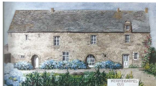
Façade septentrionale du manoir de Kerpondarmes

« Le livre de raison de Charles de Kerpondarme », Les Cahiers du pays de Guérande, n° 69 p.89-94).1890.