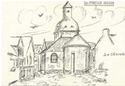
Eglise Notre Dame la Blanche de Mesquer

Au XVII ème siècle, c'est une visite épiscopale annuelle qui révèle la présence de cloches dans l'église Notre-Dame-La-Blanche de Mesquer car l'archidiacre a noté dans son rapport qu'il était défendu « ... de sonner les cloches sans nécessité sous peine de 5 sols d'amende... »