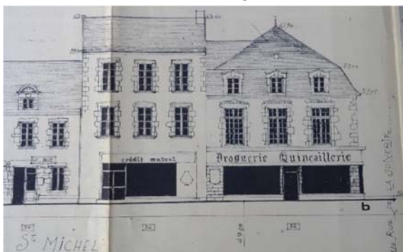
Quincallerie Gréo rue Saint Michel

Le classement en secteur sauvegardé exige un important travail d'inventaire. Chaque façade est photographiée dans son ensemble ou illustrée par ses éléments d'architecture et de décor. Chaque immeuble fait l'objet d'une très courte notice qui en précise la date et les aspects les plus remarquables. Enfin, pour chaque rue, côté des numéros pairs et côté des numéros impairs, est dressé un plan « d'épannelage ».