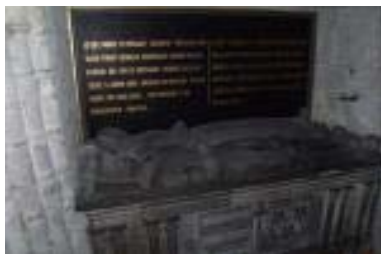
Gisant de Tristan de Carné et de sa femme

Lundi 30 septembre à 14 H 00 , accueil de la Société Historique d'Herbignac : visite de la Collégiale, du clocher et de la porte Saint-Michel (inscription à la permanence).