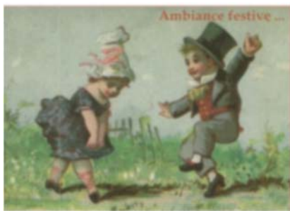
11 ème SALON DU LIVRE DE KERCABELLEC

Dimanche 4 août à Mesquer , salle Artymès, 11 ème salon du livre de Mesquer.