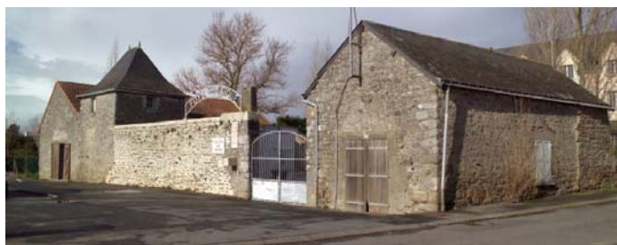
Le manoir du Bois-Rochefort à Guérande