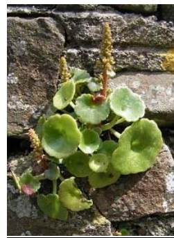
Ombilic de Vénus

De nombreuses photographies ont présenté ces magnifiques espèces repérées dans ces trois milieux naturels différents. Les remparts et vieux murs ne sont pas oubliés car ils abritent notamment la valériane, l'ombilic de Vénus, les coquelicots et l'œillet des fleuristes.