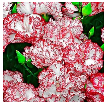
Œillet des fleuristes