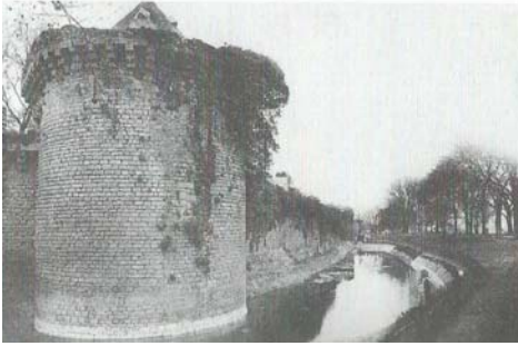
Tour Sainte Anne

Et d'abord, arrêtons-nous un peu dans cette charmante et rare petite ville de Guérande, si pittoresque avec ses anciens remparts flanqués de grosses tours et ses fossés remplis d'eau verte.