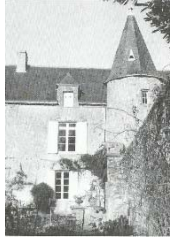
Manoir du Tricot

Dans certaines ruelles silencieuses, s'élèvent de vieux manoirs aux hautes fenêtres éclairées de vitres étroites. Les portes seigneuriales sont fermées, mais entre les ais disjoints, on aperçoit le perron envahi de verdure, des touffes d'hortensias à l'entrée, et la cour pleine d'herbe où quelque puits effrité, quelque débris de chapelle met encore un amas de pierres et de vertes floraisons.