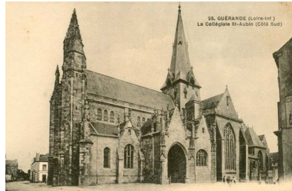
Collégiale Saint Aubin

Parfois au-dessus d'un marteau usé et vénérable, l'enseigne d'un bureau de poste, des panonceaux d'huissier ou de notaire s'étaient bourgeoisement, mais le plus souvent, ces anciennes demeures ont gardé leur cachet aristocratique, et, en cherchant bien, on retrouverait quelques grands noms de Bretagne enfouis dans le silence de ce petit coin qui est à lui seul tout un passé.