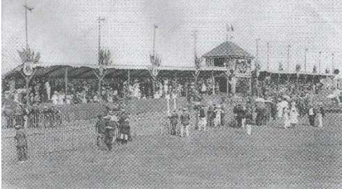
Aux courses à Tesson

Alphonse Daudet passa les étés de 1874 et de 1875 à Piriac. Il y prépara son roman Jack dont l'action se déroule pour une large part à Indret près de Nantes. Pendant ce séjour, il visita Guérande dont il a laissé une description dans « Les courses de Guérande » publiée dans « Souvenirs d'un homme de Lettres ».