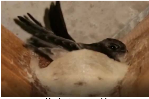
Martinets sur son nid