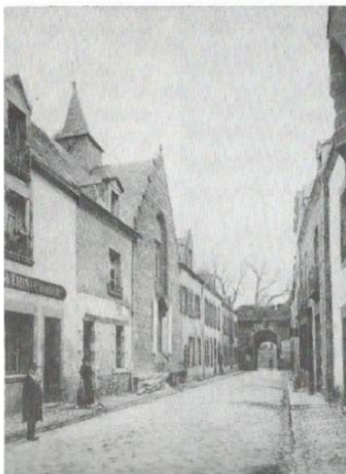
Rue et porte de Saillé, chapelle Saint Jean

Entre les vieilles pierres, les véroniques sauvages fleurissent en gros bouquets, des lierres s'accrochent, des glycines serpentent, et des jardins en terrasse suspendent au bord des créneaux des massifs de roses et de clématites croulantes. Dès que vous vous engouffrez sous la poterne basse et ronde où les grelots des chevaux de poste sonnent joyeusement, vous entrez dans un nouveau pays, dans une époque vieille de cinq cents ans. Ce sont des portes cintrées, ogivales, d'antiques maisons irrégulières dont les derniers étages surplombent les plus bas, avec des lignes dans la pierre, des ornements frustes et rongés.