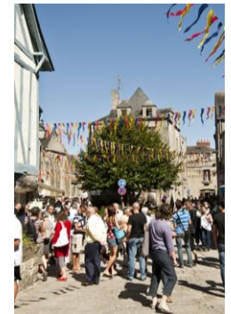
Tilleul planté en 1990

En conclusion, la commune de Guérande se caractérise par une alternance de paysages spécifiques : marais salants, espaces agricoles, secteurs boisés. Ces derniers (300 ha au total) sont localisés au niveau des domaines ou sur des sols de faible valeur agricole : Tesson, Colveux, Lessac, Métairie Neuve, la Grande Noé, les Faillies Brières, Fontenay, Domhéry, Brézéan.