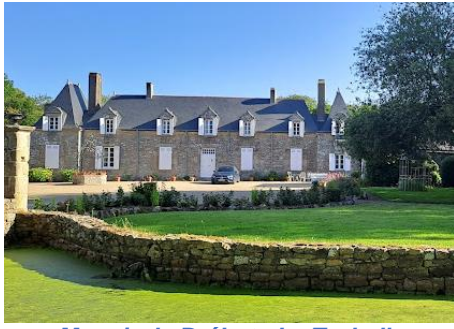
Manoir de Bréhet - La Turballe