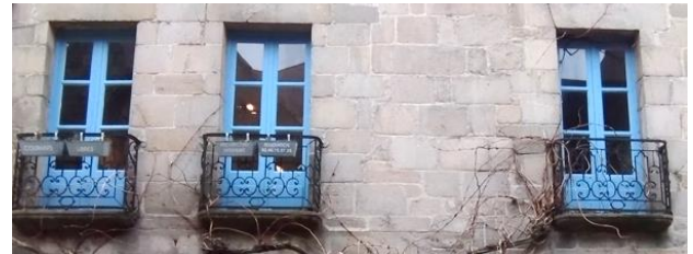
22 rue de Saillé, façade en bel appareillage de granite.

Les garde-corps présentent le même modèle de ferronneries, celui de la rue de Saillé pouvant être une reproduction un peu plus tardive. Et encore :