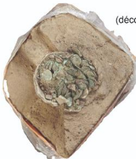
Dépôt n°2 (découvert au diagnostic)

Les 3 autres contiennent des monnaies datant du XIV e siècle, dont les plus récentes datent de 1341 / 1342.