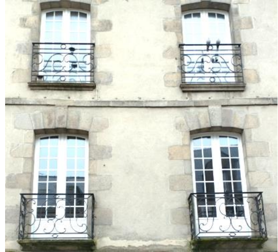
28 rue Saint Michel, ancien hôtel Rouaud de la Villemartin,

Quelques baies de maisons du XVIII e siècle disposent de petits balcons avec des garde-corps à entrelacs (fer forgé) sur des appuis moulurés. C'est notamment le cas :