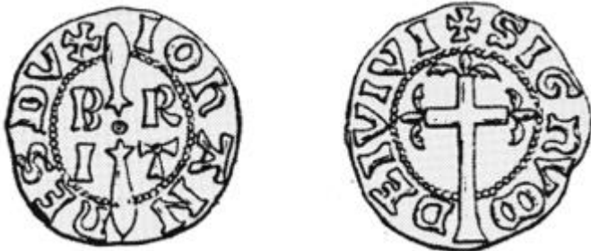
Double denier de Jean III duc de Bretagne (1312 – 1341)

Il est intéressant de noter qu'à l'intérieur des céramiques, les monnaies étaient visiblement placées dans des petits sachets textiles et l'étude permettra de dire si cela répond à une logique comptable bien précise.