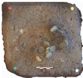
Dépôt n°1 (isolé)

Parmi ces 4 ensembles, le premier se compose de monnaies de la fin du XII e siècle sous le règne de Philippe-Auguste.