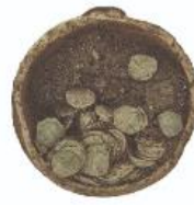
Dépôt n°3

Ceci est particulièrement intéressant puisqu'on peut assurément relier l'enfouissement de ces « magots » à un épisode historique bien connu de la guerre de succession de Bretagne, à savoir la prise et la mise à sac de la ville de Guérande en 1342 par les troupes de Louis d'Espagne.