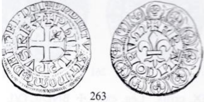
Double tournois 1 er type de Philippe VI Roi de France (1328 – 1350)