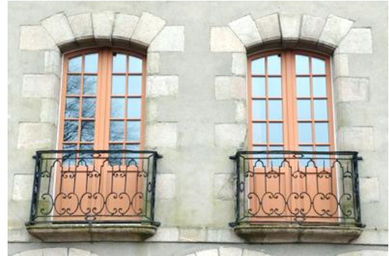
9 rue Bizienne, ancienne maison de Kergal / Couessin,