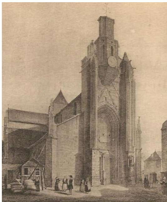
214. ANCIEN GUÉRANDE — La Collégiale Saint-Aubin, vers 1830 Au seizième siècle, un feu était allumé chaque nuit sur le campanile de la collégiale, et ce fut là, très probablement, le premier phare élevé en Bretagne.

« C'est pourquoi, étant entendu que, comme nous l'avons appris, le campanile (...) de l'église de Guérande, (...) au sommet de laquelle pendant la nuit, un feu étant habituellement entretenu, afin d'éloigner les marins allant vers Guérande des dangers de la mer, de façon à montrer à ces navigateurs le bon chemin, clocher pour cette raison fort nécessaire, a été renversé et jeté à bas il y a peu, étant entendu que après cet écroulement de la dite tour, 25 navires et d'avantage ont fait naufrage et si le campanile (...) n'est pas relevé rapidement, combien de navires plus nombreux encore, ainsi que l'on peut raisonnablement le penser, seront en danger sur la dite mer, qui semble dans ces parages particulièrement déchainée et violente... ».