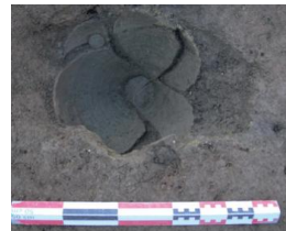
Fond de céramique

La monnaie la plus récente date de l'empereur gallo-romain Postumus, un général commandant les légions sur le Rhin qui a fait sécession contre l'autorité de Rome et a régné sur la Gaule, l'île de Bretagne et l'Espagne entre 260 et 269 après J.C. Cette unique monnaie de Postumus n'a pas été frappée à Rome mais en Gaule du Nord, sans doute dans un atelier irrégulier de faussaires.