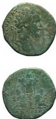
Sesterce de Septime Sévère (193 - 211)

Le revers comporte souvent des allégories représentant des dieux ou des déesses du panthéon romain. Il peut aussi commémorer un événement particulier comme par exemple une campagne militaire heureuse ou le décès d'un mem-