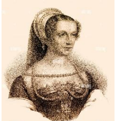
Reine Claude (1499-1524)

A l'occasion d'une recherche sur l'éclairage des côtes de la région, l'éventualité a été envisagée de l'utilisation de la collégiale pour porter un feu de signalisation avant l'introduction des phares par Fresnel. Jusqu'au début du XVII ème siècle, cette signalisation ne pouvait être qu'un grand feu de branchages allumé toute la nuit au sommet d'une tour, dite « Tour à feu ».