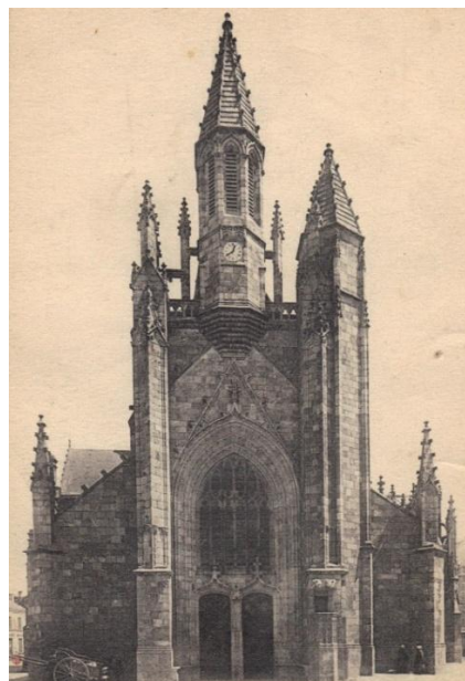
Carte postale des années 1930 – Collection personnelle

Le campanile a certainement été restauré pour s'effondrer à nouveau, comme le montre cette gravure de 1835 issue de l'ouvrage d'Abel HUGO « Département de la Loire Inférieure, description... » réédité par les éditions du Bastion, Nantes 1990.